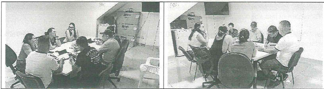
Evidencia reunión de socialización ruta barrio oasis de terranova. Junio 06 de 2025

Se realizo mesa de socialización con representantes de la comunidad de Oasis de Terranova en razón al cumplimiento de la Resolución No 0008 de Diciembre 19 de 2019 modificó el recorrido ruta Alfaguara -Terranova - ruta 6 otorgada a la Empresa Montebello.