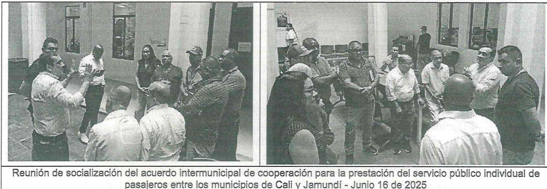
Reunión de socialización del acuerdo intermunicipal de cooperación para la prestación del servicio público individual de pasajeros entre los municipios de Cali y Jamundí - Junio 16 de 2025

Durante la ejecución de periodo contractual se presto apoyo en la revisión y socialización sobre la legalidad del acuerdo intermunicipal de cooperación para la prestación del servicio público individual de pasajeros entre los municipios de Cali y Jamundí donde se Establecen condiciones para la prestación del servicio público de transporte individual de pasajeros en vehículos tipo taxi dentro del corredor Cali - Jamundí, en aplicación del artículo 141 de la Ley 769 de 2002